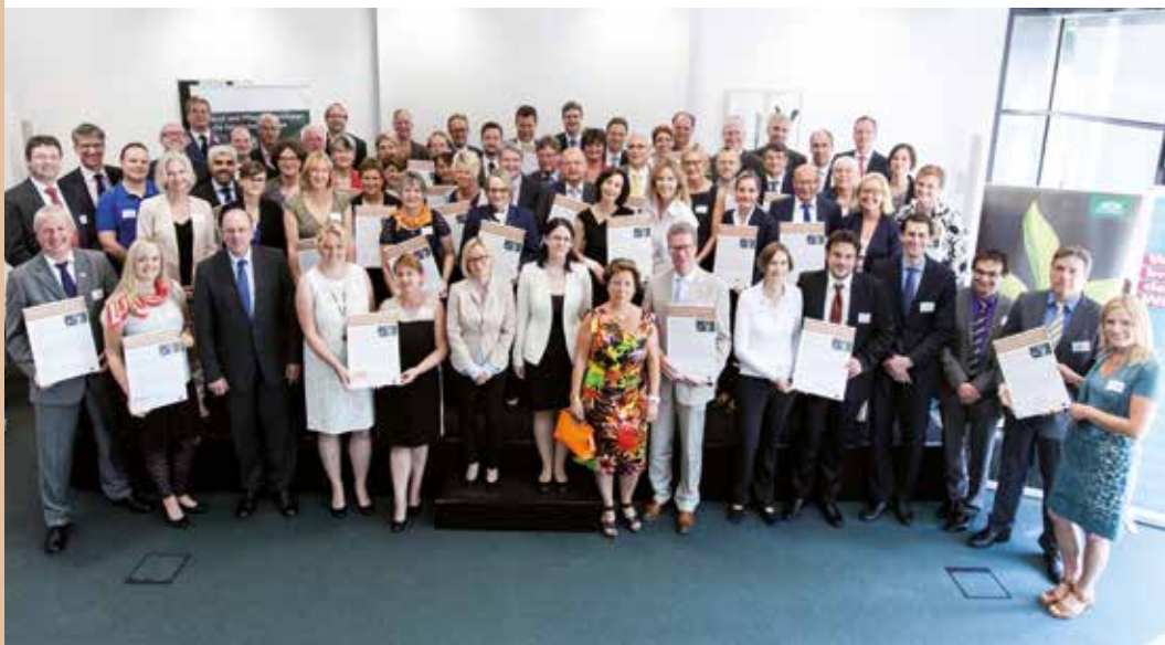
Freude über großes Interesse an der Initiative

Sie alle bekennen sich zu einer pflegesensiblen Personalpolitik und setzen ein deutliches Signal, das zur Enttabuisierung von Pflege und zur offenen Kommunikation im Betrieb beiträgt.